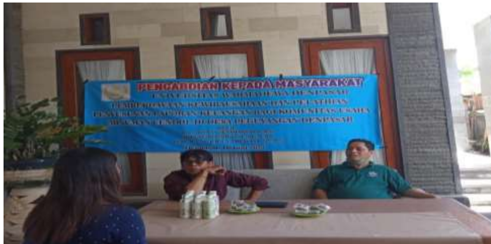
Gambar 2. Materi Literasi Kewirausahaan